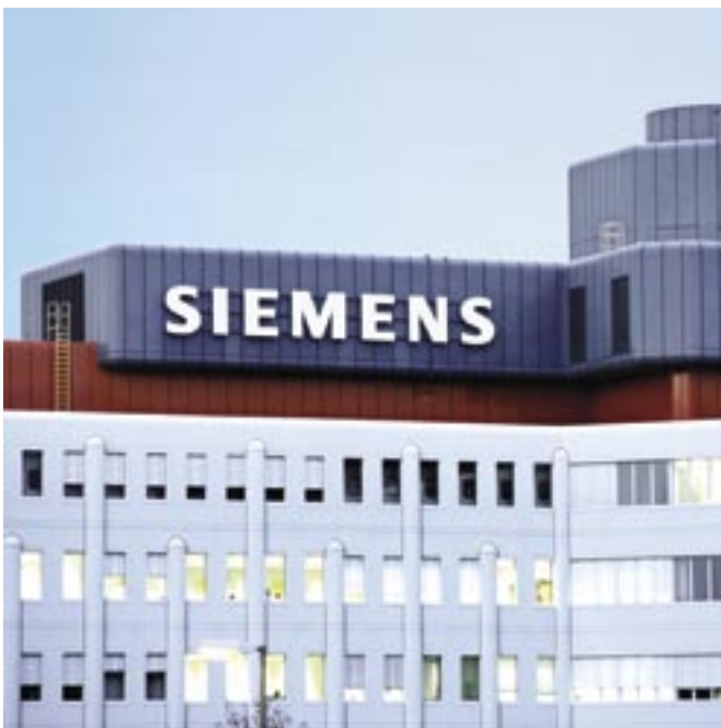
↑ Лабораторно-исследовательский центр SIEMENS в Нойперлах, Бавария

мощностью от 600 Аэроватт и выше. Это позволило сократить время уборки, улучшить силу всасывания, увеличить КПД в среднем на 30-50% по сравнению с аналогичными системами, соответственно сократить потребление электроэнергии. Кстати, в ходе исследований, проведенных лабораторией SIEMENS, установлено, что использование систем мощностью менее 500 Аэроватт нецелесообразно. Минимальная мощность центрального пылесоса по немецким стандартам должна составлять 500 аэроватт. Поэтому самый маленький центральный пылесос BVC mit SIEMENS motor S500 — такой мощный (600 Аэроватт).